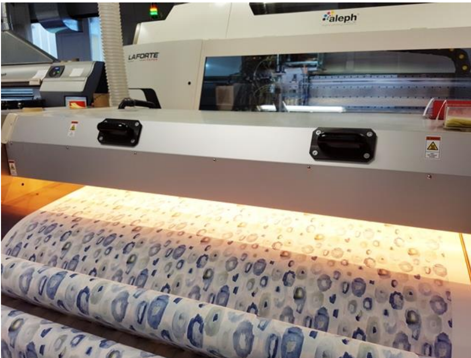
La stampante digitale di grande formato LaForte® Paper in azione all'interno del reparto stampa di Silkomo.